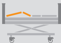
REGULACJA SEGMENTU NÓG