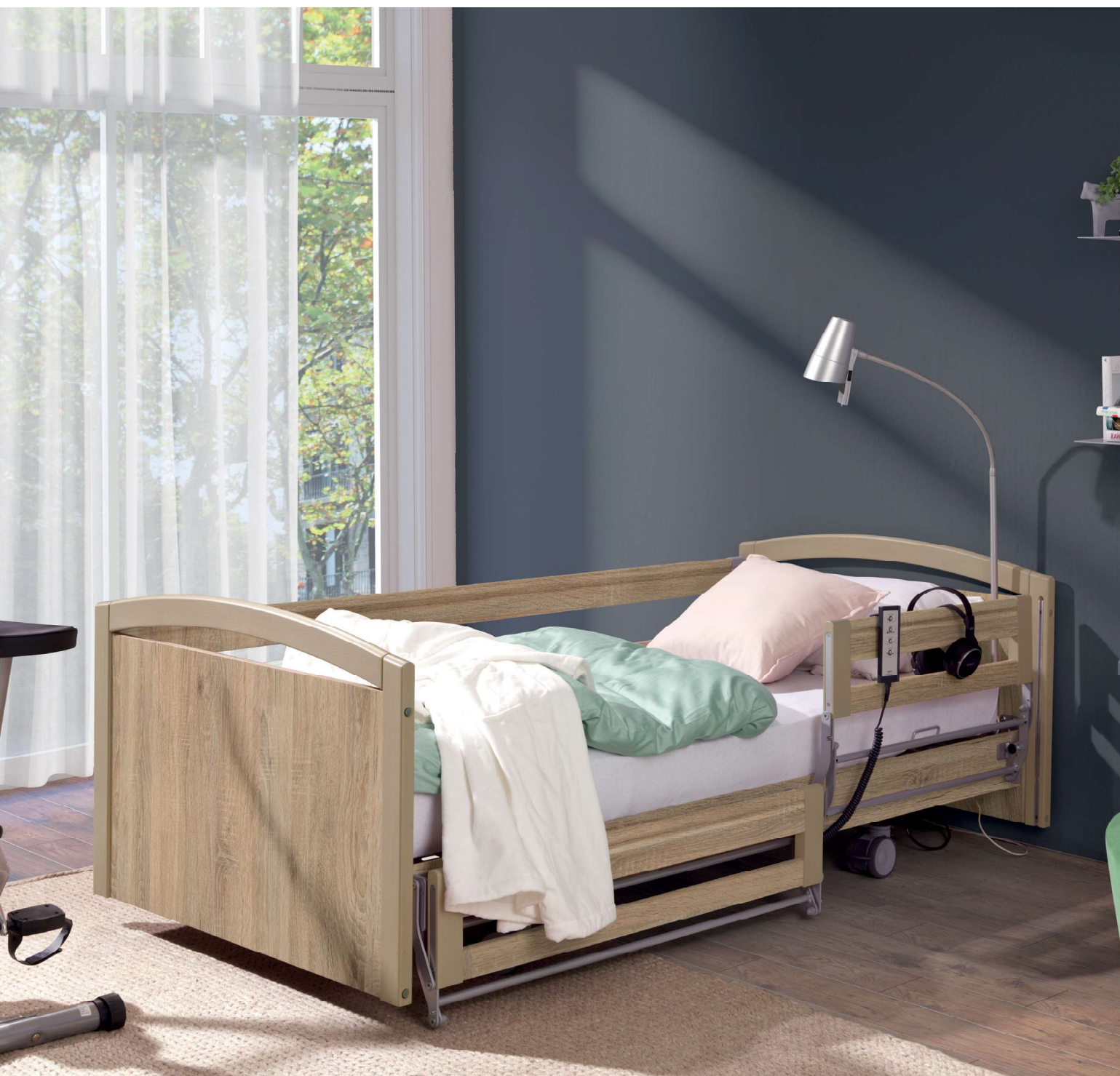
Na zdjęciu: łóżko PB 636 w kolorze dęb sonoma z dzielonymi barierkami po jednej stronie łóżka. Akcesoria: Lampa przyłóżkowa.

Szczególną cechą modelu łóżka PB 636 jest możliwość opuszczenia leża do poziomu 29 cm. Niska pozycja pozwala na większy komfort użytkowania osobom o niższym wzroście oraz redukuje w znacznym stopniu możliwość odniesienia urazu w sytuacji przypadkowego wypadnięcia. Zakres regulacji wysokości, pozwala na pracę opiekunów w optymalnych warunkach. Możliwość stosowania dzielonych barierek powoduje, że użytkownik nie musi być na stałe ograniczony barierami w przestrzeni łóżka.