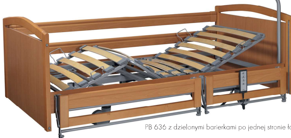
PB 636 z dzielonymi barierkami po jednej stronie łóżka