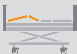
REGULACJA SEGMENTU NÓG